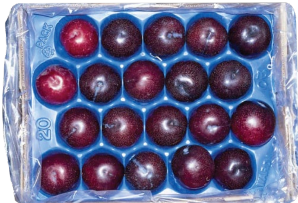
■ Paketim i përshtatshëm për kumbulla të klasës ekstra dhe I