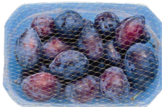
■ Paketim i vogël