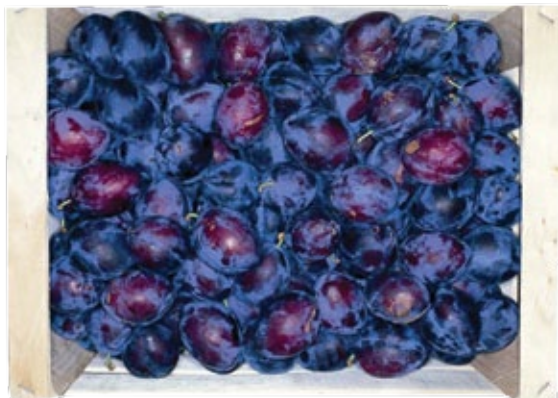
■ Paketim i kumbullave në arkë druri – Klasa II